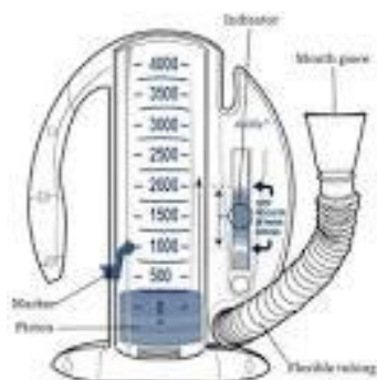
How to Use an Incentive Spirometer