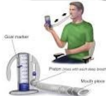
How to Use an Incentive Spirometer